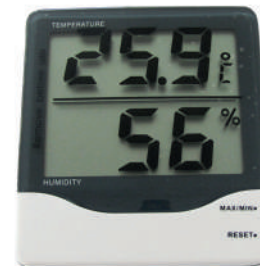
MC820 Dim.: 110x100x25mm

Temperatures between -10°C and 60°C. Works with humidity between 10 and 99%. Minimum and maximum values memory.