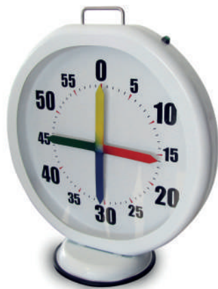
T4014 Dim.: 57x50x9cm | Diam.: base / base 25cm