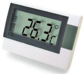
MC808 Dim.: 52x38x15mm