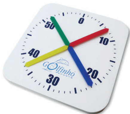
E539 Dim.: 80x80cm | 220V/50Hz

Made of fiberglass with polycarbonate front protection with UV protection. Minute and second hand. Works with batteries.