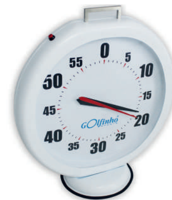
T4009 Dim.: 57x50x9cm | Diam.: base / base 25cm

Made of fiberglass with polycarbonate front protection with UV protection. Works with batteries. Portable. Crossed pointers in 4 different colors.