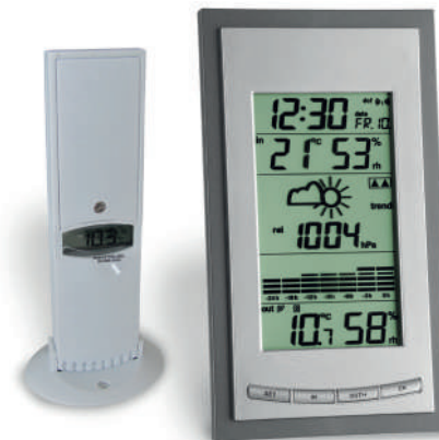
MC817 Dim.: 100x35x180mm