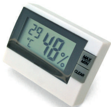
MC812 Dim.: 52x38x15mm

Exterior humidity and temperature with a long distance transmitter (+100m, expandable to 3 transmitters). Interior humidity and temperature. Highest and lowest values. Meteorological forecast by symbols. Atmospheric pressure tendency and its evolution in the past 24h. Date and clock. Batteries included.