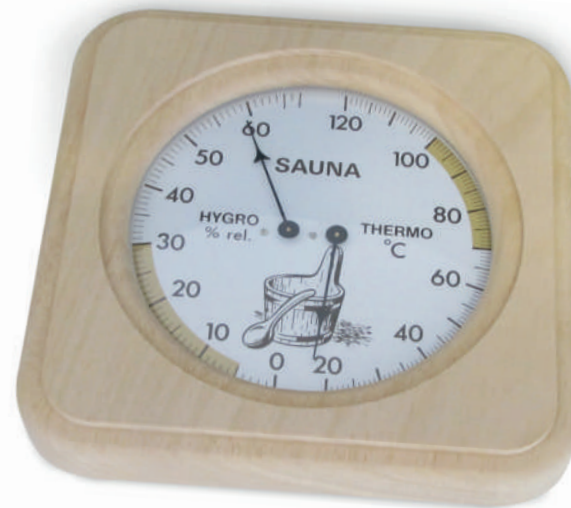
MC831 Dim.: 175x34x175mm

Digital clock with temperature and humidity information. Thermometer: -10 to +50 °C (digits w / 10.5cm in height). Hygrometer: 20% to 99%. Weight: 880 grams. Application: Wall or table. Power: 4x1.5V AA batteries