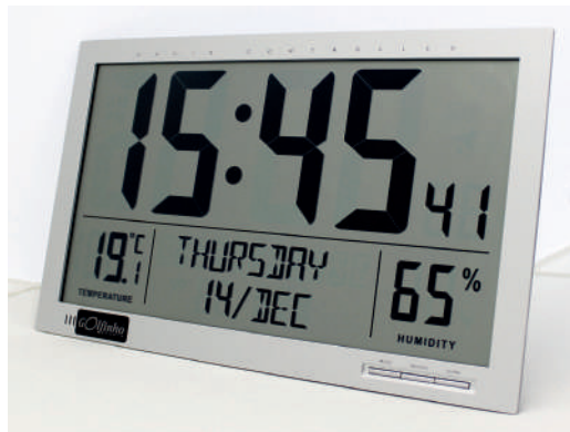
MC833 Dim.: 37x3x23cm